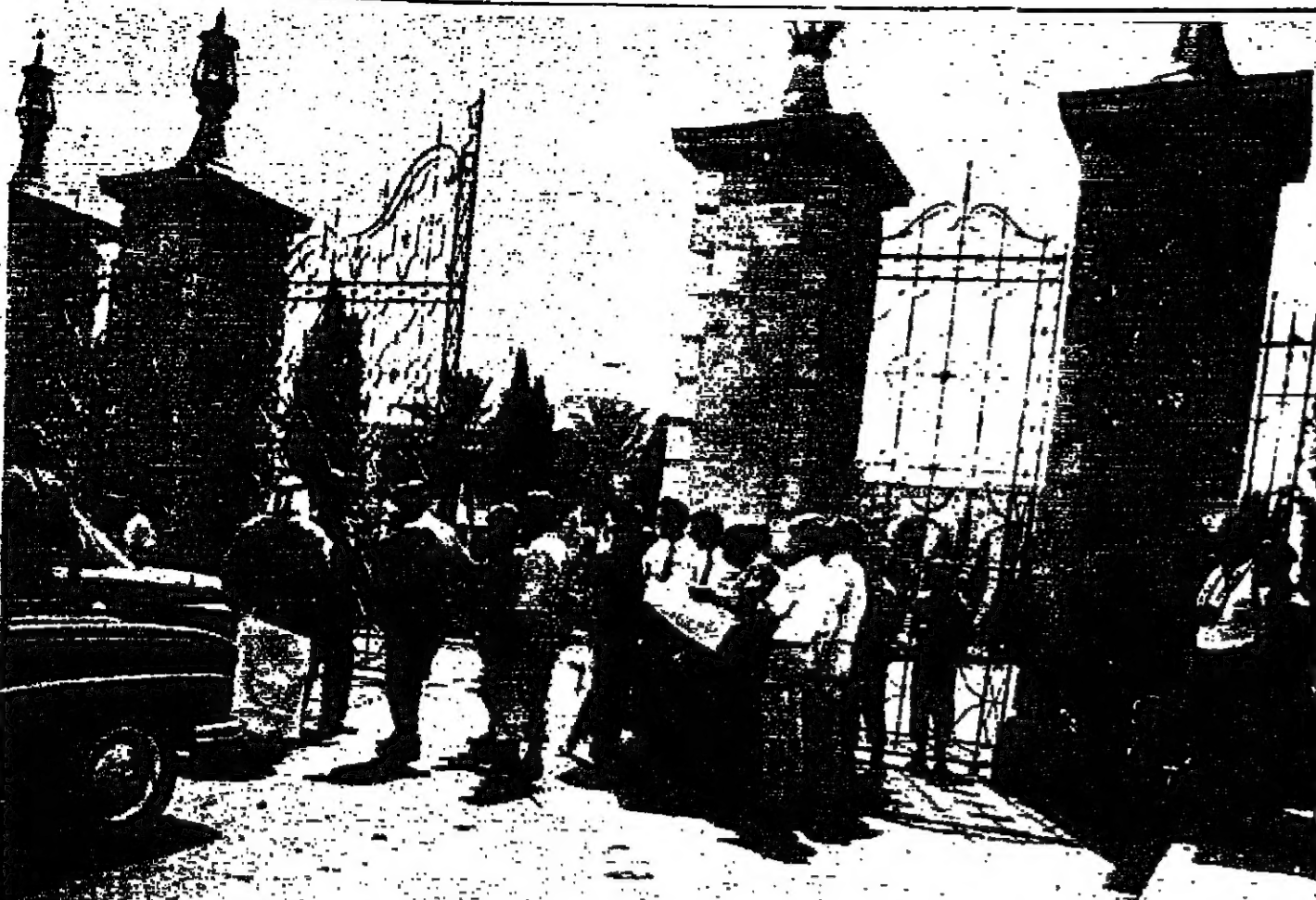
المصنفون الجليل ينتظرون التبايعات الجديدة الرئيسية قصر الرئاسة في بغداد يوم ١٨ نوز الجاري اي بعيد واحد من الانقلاب الجديد الذي اطلقه بالزئير السابق عبد الرحمن عارف